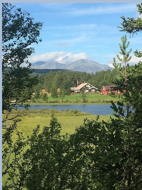
Utsikt over Lona