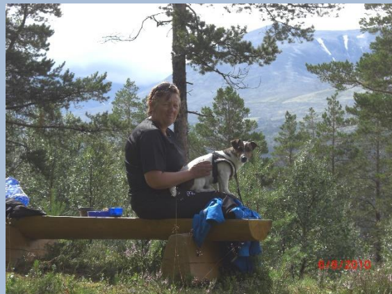
Utsikt mot Store-Elgvasshøe

Du krysser Fv. 27 ved Stodsbuøye og følger den 300 m sørover, svinger av til venstre inn på gårdsvei og tar så av til høyre igjen etter 20 m. Du er nå inne på Gammelveien igjen og vil også se en info-tavle her om veien. Herfra går veien forholdsvis høyt oppe i dalsiden med veldig god innsikt inn i Rondane. Det er flere muligheter til å avbryte turen på tur sørover å sykle ned på Fv. 27. Turen slutter på Straumbu rasteplass. Her er det både brus og is å få kjøpt. Hva med å prøve hengebrua ved Straumbu, kanskje kommer det en kano forbi også.