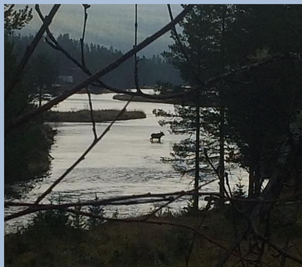
Elgen har sin faste vade plass rett nedenfor campingen

Skogli Camping Finnstadveien 50 2477 Sollia