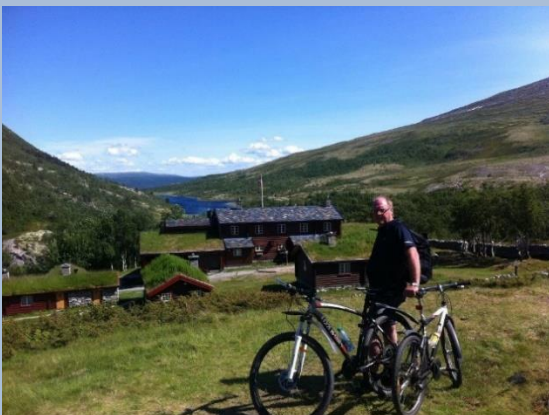
Bjørnhollia sett mot Musvoldtjønna

Skogli Camping Finnstadveien 50 2477 Sollia