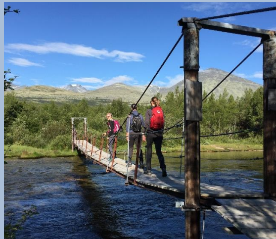
Hengebru ved Straumbu