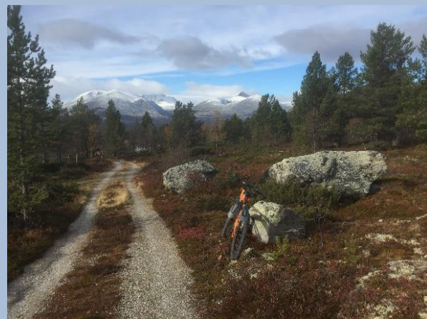
Utsikt fra Sjølisetra