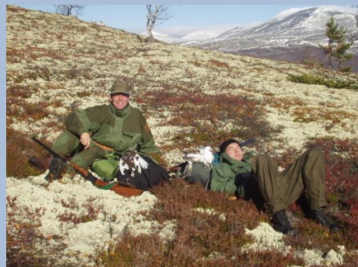
Rypejakt, for info se www.sollia-fjellstyre.no