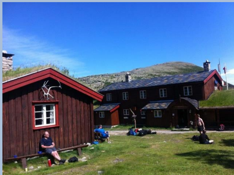
Bjørnhollia, et populært turmål