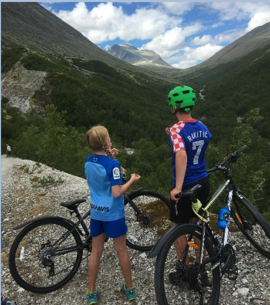
På vei til Bjørnhollia, Rondeslottet i det fjerne.